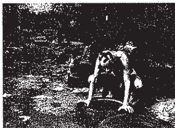
► New York, 1983.

Ce qui caractérise la situation sociale de ces dernières années, c'est la précarité. Jamais elle n'a atteint un degré aussi institutionnalisé. Elle pèse sur les décisions à tous les niveaux de l'activité sociale. Elle provoque le glissement progressif des valeurs démocratiques de l'ensemble des comportements, lesquels dérapent vers l'absurde et provoquent le retour à l'obscurantisme. Déjà très difficile à freiner, cette déroute s'amplifie gravement. Qu'il s'agisse de l'éducation, de la justice, de la santé ou de l'emploi, la précarité n'est pas seulement centrale, elle est un contexte ! Elle fragilise le tissu social qu'elle rend à la fois pulvérulent et explosif.